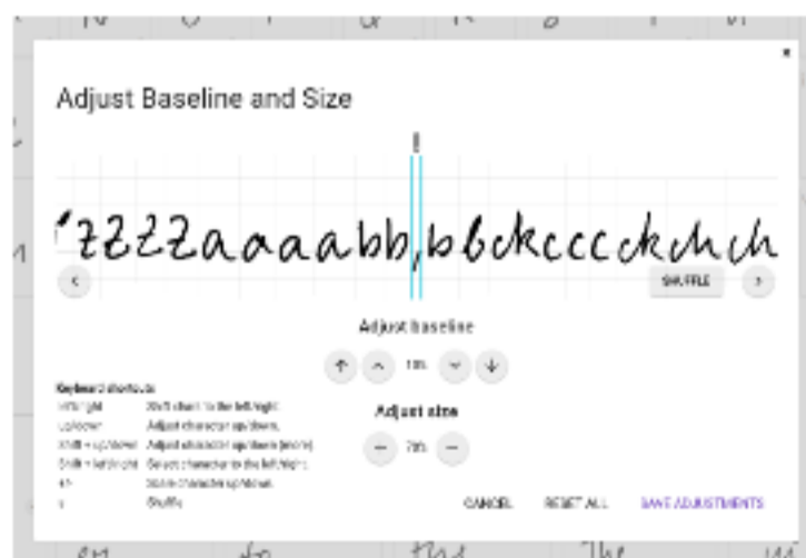
ベースラインとサイズを調整する